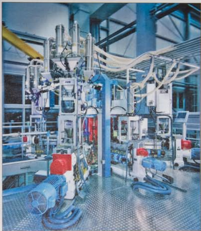
Komplexes Materialhandling von FDM für die Fertigung von Barrierefolien für Wurstverpackungen

„Für einige 7-Schicht-Coextrusionsanlagen zur Herstellung von Barrierefolien für Wurstverpackungen haben